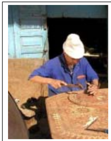
Les grappes de cuir

L'expérience italienne avec ses 300 consortia d'exportation regroupant presque 7000 entreprises a bien démontré l'importance et l'efficacité des consortia pour la survie et le développement des PME.