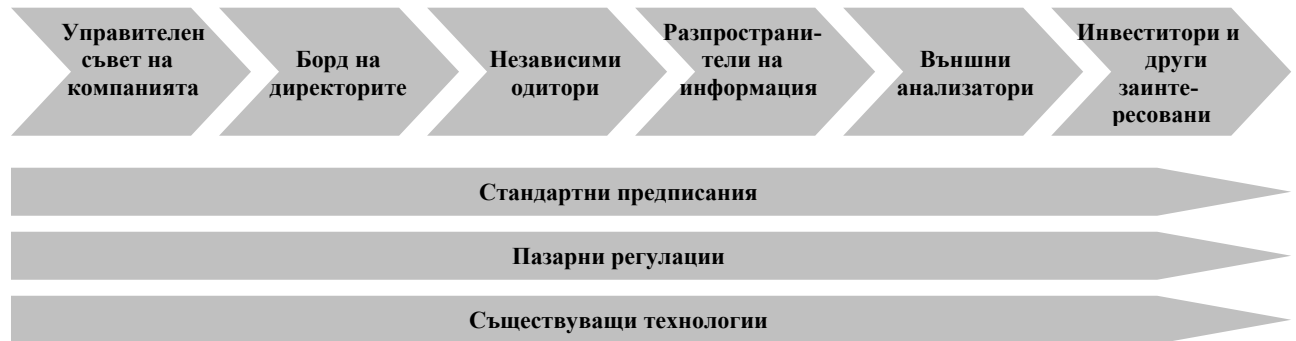
Фигура 1: Верига/система за корпоративно отчитане

Движещата сила за по-ефективно отчитане също води началото си от разбирането, че традиционните отчитачи параметри не могат да отчетат някои от ключовите активи, които са тясно свързани с днешният бизнес базиран на знанието. (фиг.2 ) Това е съвпадна с triple bottom line отчитането (покриващо икономически просперитет, качество свързано с дадена среда и обществена справедливост), които произтичат от отчета на Комисията Буртланд от 1987 г.