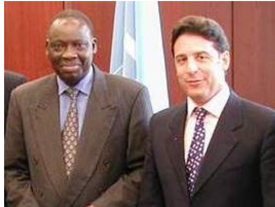
Le Président Moussa Touré et le Directeur-Général Carlos Magariños à l'inauguration officielle du Programme UEMOA, à Vienne, le 17 septembre 2001

Le projet a été officiellement lancé le 17 septembre 2001 à Vienne par le Président de la Commission de l'UEMOA, Moussa Touré, et le Directeur-Général de l'ONUDI, Carlos Magariños. Ils ont profité de cette occasion pour réitérer l'importance cruciale de ce programme dans le développement du commerce régional grâce à l'harmonisation des normes et des réglementations techniques dans la région. Dans le même temps, l'accréditation internationale des laboratoires nationaux facilitera l'accès des exportations aux marchés d'Europe et du reste du monde. Un tel renforcement du commerce, ont-ils insisté, est essentiel pour le développement économique de la région.