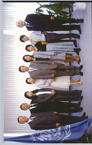
東京事務所スタッフ Staff of UNIDO ITPO Tokyo (as of September 2008)

民間企業による途上国への直接投資や技術移転を支援することが設立の目的で、日本企業と途上国を繋ぐために、さまざまな事業を実施しています。近年は、環境保全を重点目標とし、技術協力の案件形成なども支援しています。