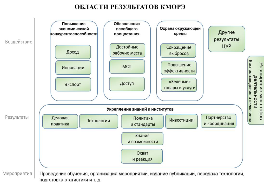
Рисунок В. Схема результатов организационной деятельности 2

19. Охват, реакции, знания и возможности. ЮНИДО на систематической основе взаимодействует с субъектами, чьи методы работы, технологии, инвестиции и политика имеют решающее значение для содействия индустриализации. Это могут быть субъекты любого уровня: от фирм и отдельных лиц на микроуровне до государственных и частных учреждений-посредников, а также правительств и глобальных учреждений на макроуровне. Одним из ключевых компонентов преимуществ ЮНИДО являются тесные взаимоотношения с этими бенефициарами и институтами, а также их поддержка. Это особенно важно в случае частных компаний в развивающихся странах. Повышение информированности, аккумулирование и передача знаний, а также наращивание потенциала в областях, сложных как с технической, так и с политической точки зрения, относятся к числу наиболее важных результатов проектов, отличающихся такой технической сложностью, как проекты ЮНИДО. Эти результаты являются основными компонентами стратегического приоритета «Укрепление знаний и институтов».