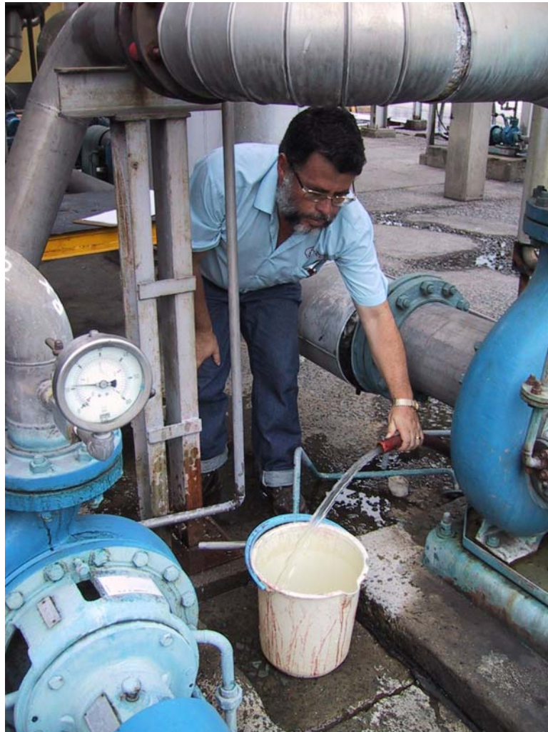
“El ingeniero del balde”

El cubo y el cronómetro son herramientas de medición simples y exactas. Para usar este método, recoja una cantidad específica del agua de proceso por un período de tiempo específico (Ej. 10 litros en 1 minuto).