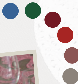
Table runners MACHINE EMBROIDERY

1.-TABLE RUNNER 40x140cm.,100% cotton, machine embroidery, green.- PLACE MAT 40x30cm., GLASS MAT 15x15cm.- 2.- TABLE RUNNER 40x140cm.,100% cotton, machine embroidery, bordeaux.- PLACE MAT 40x30cm., GLASS MAT 15x15cm. 3.- TABLE RUNNER 40x140cm.,100% cotton, machine embroidery, pink.- PLACE MAT 40x30cm., GLASS MAT 15x15cm.- 4.- TABLE RUNNER 40x140cm.,100% cotton, machine embroidery, blue.- PLACE MAT 40x30cm., GLASS MAT 15x15cm. 1, 2, 3, 4.-НАСТОЛЬНАЯ ДОРОЖКА 40x140 см., 100% хлопок, машинная вышивка- ПОДАРЕЛЬНИК 40x30 см.- 100% хлопок, машинная вышивка.- ПОДСТАКАННИК 100% хлопок, машинная вышивка 15x15cm.