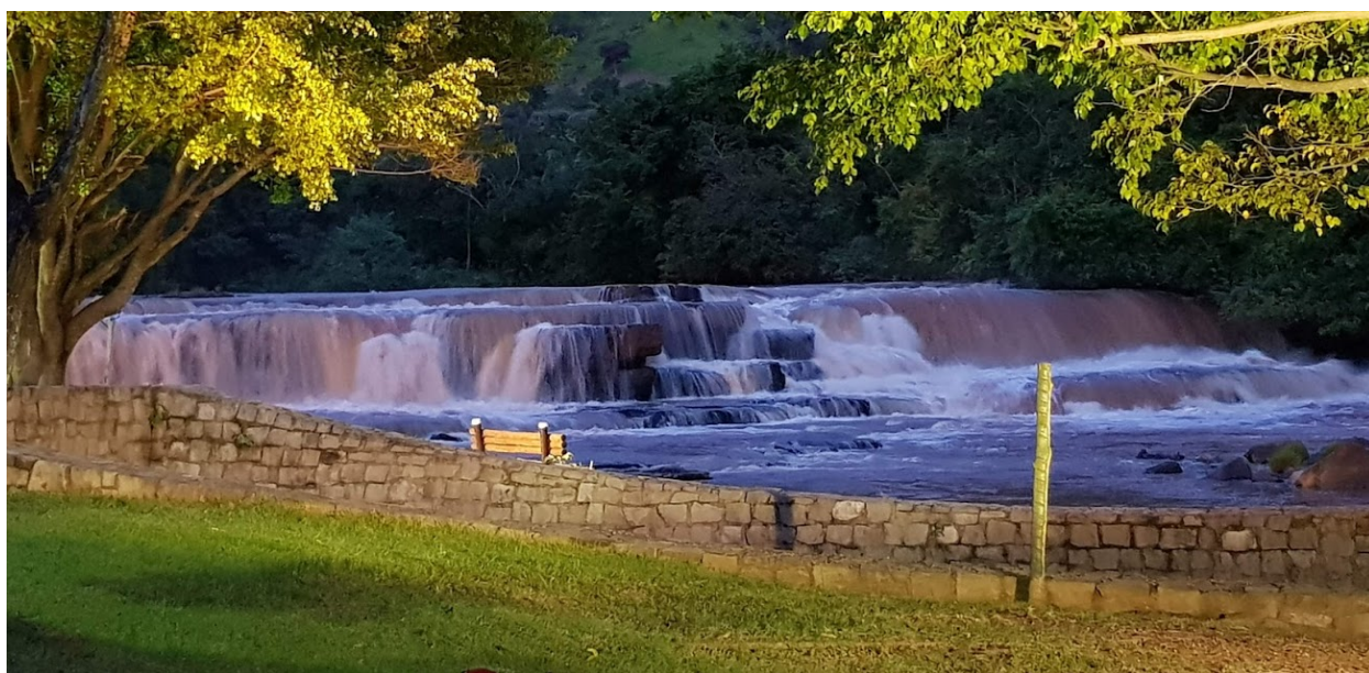
Figura 1. Cachoeira Salto do Céu. Em: 31/01/2020.

Esse documento sintetiza os resultados obtidos a partir das Oficinas para diagnosticar o município sob a ótica da comunidade e gestores municipais na zona urbana e rural, realizadas em diferentes locais no Município de Salto do Céu, estado de Mato Grosso, para implantação do Plano Diretor de Desenvolvimento Municipal, assim com das oficinas do Plano de Ação.